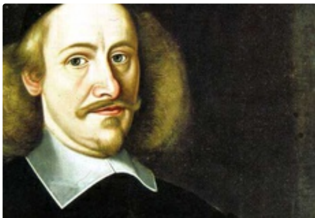
Otto von Guericke